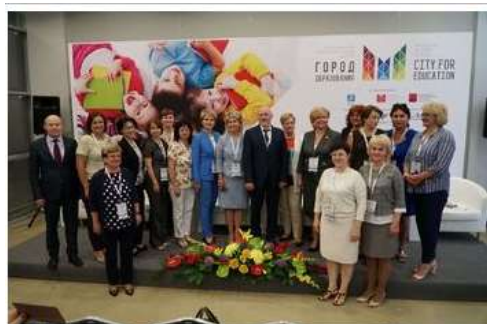
Предложение о создании проекта по взаимообучению городов прозвучало в ходе форума Город образования

В Московском центре развития кадрового потенциала образования сообщили о том, что проект по взаимообучению российских городов планируется запустить в конце сентября. В рамках проекта представители систем образования городов России будут транслировать эффективные управленческие и педагогические практики.