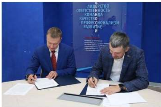
Стороны объединяют усилия для качественного развития профессиональной методической помощи педагогам

Корпорация "Российский учебник" и онлайн-школа "Фоксфорд" договорились о совместной разработке и реализации научно-образовательных проектов для учителей. Соответствующее соглашение представители организаций подписали 11 сентября.